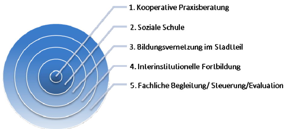
Abb. 1: Säulen der Kooperation in der Bildungslandschaft Jena

Die Säulen 1 bis 3 sind inhaltlich unterschiedlich untersetzt und bedürfen daher einer weiteren Fortentwicklung. Im Anschluss an eine Übersicht der fünf Kooperationssäulen werden die einzelnen Bestandteile erläutert.